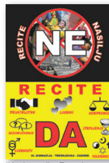
IX. gimnazija, Zagreb, Nagradjeni plakat