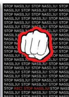
Škola za primijenjenu umjetnost, Rijeka